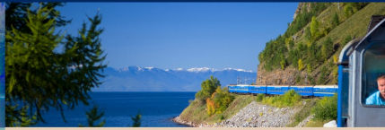
Trenes de Lujo