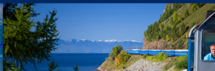
Trenes de Lujo